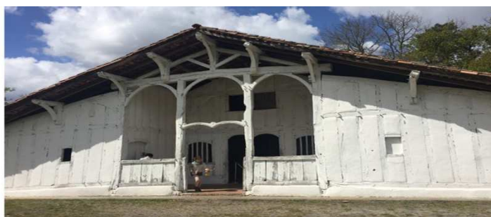
Photo prise à l'Ecomusée de Marquès